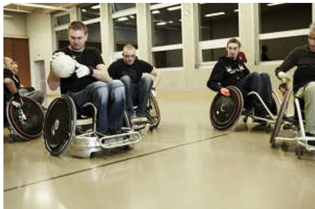
Sport ist ein wichtiger Bestandteil der Ausbildung