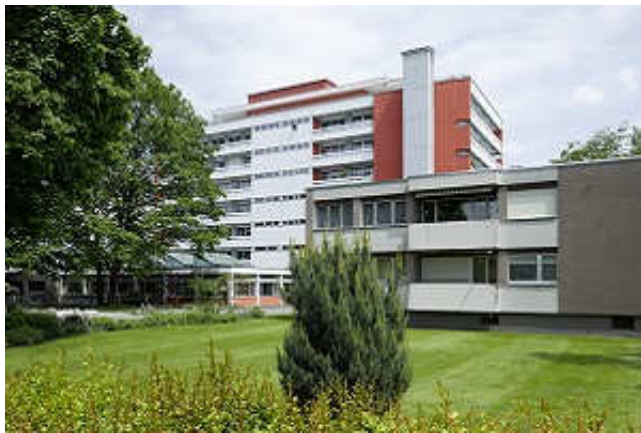
Im Rossfeld wohnen und arbeiten die Schüler.